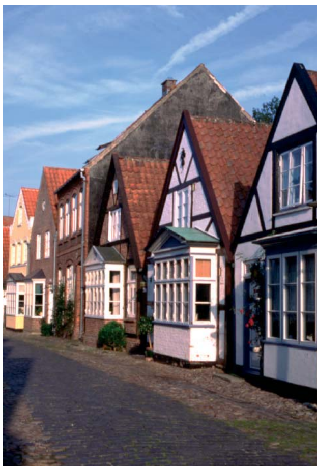
Uldgade i Tønder.

I forbindelse med udpegning af kulturmiljøer i regionplanerne har der været udført en række mindre projekter med relevans for Vadehavsregionen. Det metodeudviklende KIP-projekt (Kulturhistorien i Planlægningen), der blev gennemført af Skov- og Naturstyrelsen sidst i 1990'erne, havde dele af Ribe Amt som pilotprojektområde, og i forbindelse med kulturmiljøudpegningerne i Sønderjyllands Amt foretog amtets museer en gennemgribende registrering, som senere blev ud-