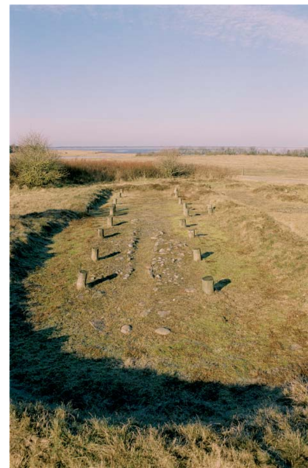
Jernalderboplads ved Myrthue.

Vadehavsområdet har en rig kulturhistorie, som bærer vidnesbyrd om menneskets liv i og brug af landskabet fra oldtiden til i dag. Mange af de kulturhistoriske træk, vi finder i Vadehavsområdet, er enestående i dansk sammenhæng. Det gælder først og fremmest værfterne, men også kogene og den karakteristiske bebyggelsesstruktur med landsbyerne beliggende på geestranden. Dertil kommer købstædernes lange og spændende historie, Vadehavsoernes maritime tilpasning, påvirkningen fra den frisiske kultur i først og fremmest bygningskulturen samt områdets beliggenhed i et grænseland.