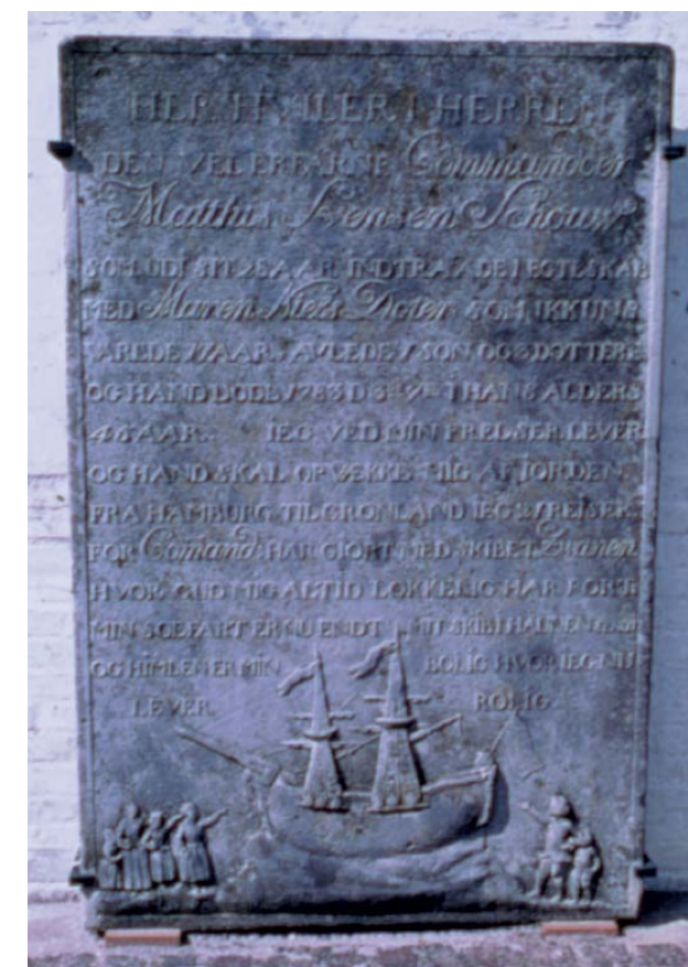
Kommandørsten fra Rømø.

Til den materielle kulturarv knytter der sig en immateriel kulturarv, som handler om skikke, vaner og færdigheder - hvordan man gør tingene i praksis. Denne er ofte vanskeligere at bevare, fordi den kræver en stadig udøvelse og vedligeholdelse af den kundskab, der er tale om. Engvanding, knipling, havebrug, jagt og musikudøvelse er blot nogle af de aktiviteter, hvor der anvendes overleveret viden. Flere af årets begivenheder er velegnede til at stifte bekendtskab med den immaterielle del af kulturarven, f.eks. Fannikerdagen og Sønderhodagen på Fanø. Endelig er der nutidens brug af landskabet, som i mange tilfælde baserer sig på det liv, der er levet i området gennem generationer.