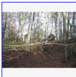
Petershal, nu familiecentret Vibygård.