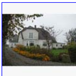
Husmandssted, Teglværksvej 1, under omdannelse til villa.

Disse huse ligger i forlængelse af sommerhuskvarterets sydligste grunde, og vejstykket har derfor en blandet karakter af yngre og ældre sommerhuse, grundmurede husmandssteder og husmandssteder opført i bindingsværk. Mere problematisk er den materialemæssige fornyelse: husene bliver for "fine" og villaprægede.