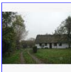
Særlig høj bevaringsværdi har bebyggelsen i vest med velbevarede husmandshuse, vejtræer og milesten.

Af kulturhistoriske spor fra teglværket er - foruden husmandsstederne - teglværksgården og karrene tilbage, samt den lange tange ud fra skrænten, hvorfra tipvognene rutschede ned og løb ud af tangen mod dybt vand til skibet, der skulle føre lasten af brændte teglsten ud til kommende byggerier. Der er et rigt fugleliv, og tangen bliver brugt til græsning. Desuden ligger der nogle småbåde.